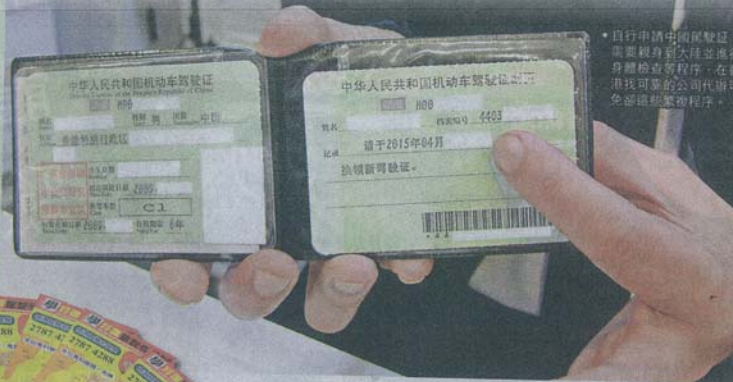
自行申請中國駕駛証，需要親身到大陸並進行身體檢查等程序，在香港找可靠的公司代辦可全部這些繁瑣程序。

越來越多人到大陸公幹、定居，而若要在國內駕車當然要申請中國駕駛証。香港人只要持有有效回鄉卡及本地駕駛執照便可以申請，本地亦有不少駕駛學校代為辦理，只是各申請人士可能對中國駕駛証認識不多，而且市面亦出現懷疑假冒駕駛執照以超平價作招徠，為免得不慎失，當然要找來信譽昭著的專家教路，教識大家認清真「証」的貼士。