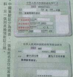
中國駕駛証分為兩張，一張有姓名及住址等資料，另一張則是換領新証日期。